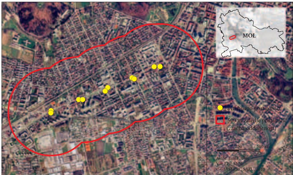
Slika 2: Vzorčno območje testiranja kakovosti podatkov o omrežju pešpoti.

Tega smo se lotili tako, da smo najprej izbrali deset vzorčnih postajališč, kar v bazi vseh 498 postajališč znotraj mestne občine Ljubljana predstavlja 2 % delež. Lokacije postajališč se nahajajo ob mestni vpadnici na Tržaški cesti med Tobačno na severovzhodu in bližino trgovskega centra Interspar na jugozahodu testnega območja (slika 2). Postajališča smo izbrali na način, da njihova zaledja obsegajo čim bolj različne tipe rabe tal, kar daje vzorčnemu območju oziroma analizi kakovosti podatkov večjo reprezentativno moč. Že pri zajemanju podatkov smo namreč ugotovili, da obstajajo razlike v težavnosti zajema podatkov glede na vrsto rabe tal. Testno območje z lokacijami vzorčnih postajališč tako obsega dele enostanovanjskih družinskih hiš in vil na območjih Rožne doline, Viča in Trnovega, območja večstanovanjskih blokov na Viču, večje nakupovalno središče Interspar na Viču in ostala območja s storitvenimi