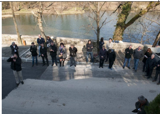
Del lokalne publike na otvoritvi.