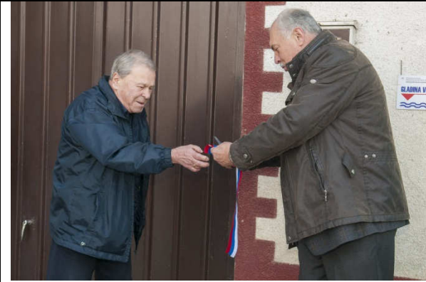
Lastnik hiše in podžupan.