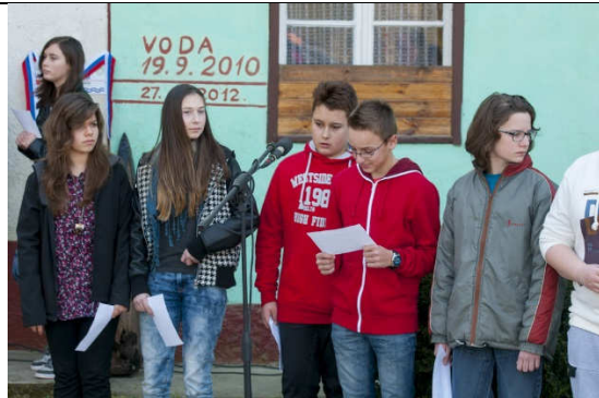
Kulturni program je pripravila OŠ Miren.