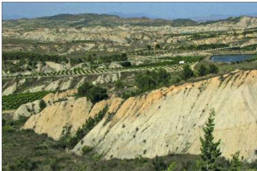
Slika 4: V španski pokrajini Murcia je zaradi sušnega podnebja in degradacije tal veliko erozijskih žarišč.