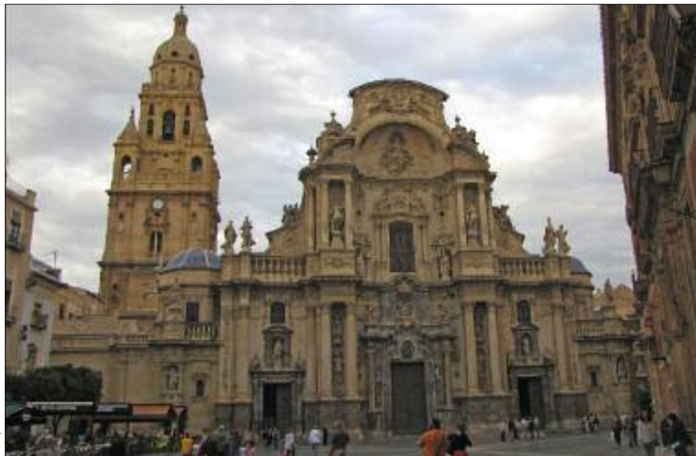
Slika 3: Katedrala v Murciji je bila zgrajena v 15. stoletju v kastiljskem gotskem slogu.