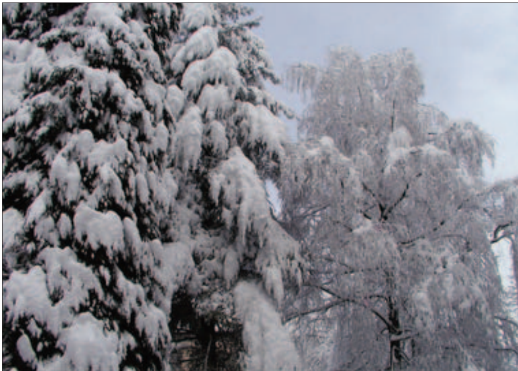
Slika 2: Primerjava pestreženih snežnih padavin iglavcev (levo bor) in listavcev (desno breza).

rašče, izhlapi nazaj v ozračje in jih imenujemo izhlapele prestrežene padavine E_i (angleško interception loss ). Ko je skladiščna zmogljivost krošnje zapolnjena, del prestreženih padavin prikaplja s krošenj do tal, del padavin pa pade na tla neposredno skozi odprtine med krošnjami in listi. Oba dela merimo in obravnavamo skupaj kot prepuščene padavine T_f (angleško throughfall ). Manjši del prestreženih padavin se steka z listov in vej po deblu do tal. Ta del imenujemo odtok po deblu S_f (angleško stemflow ). Vsota prepuščenih padavin T_f in odtoka po deblu S_f je navadno bistveno manjša od količine padlih padavin, razen če je veliko megle (Bruijnzeel 2000).