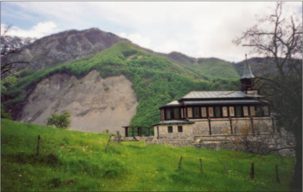
Slika 10: Cerkvica sv. Duha na Javorci stoji nasproti podoru (14. 5. 2004).