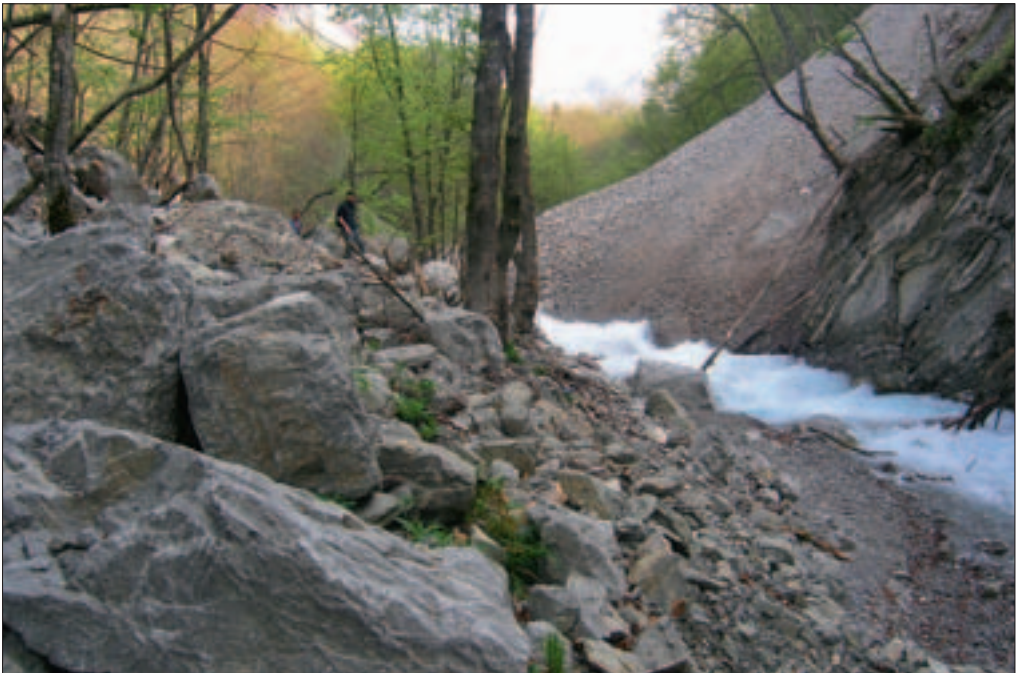
Slika 4: Podorno gradivo je uničilo gozd in odstranilo preperino (24. 4. 2006).