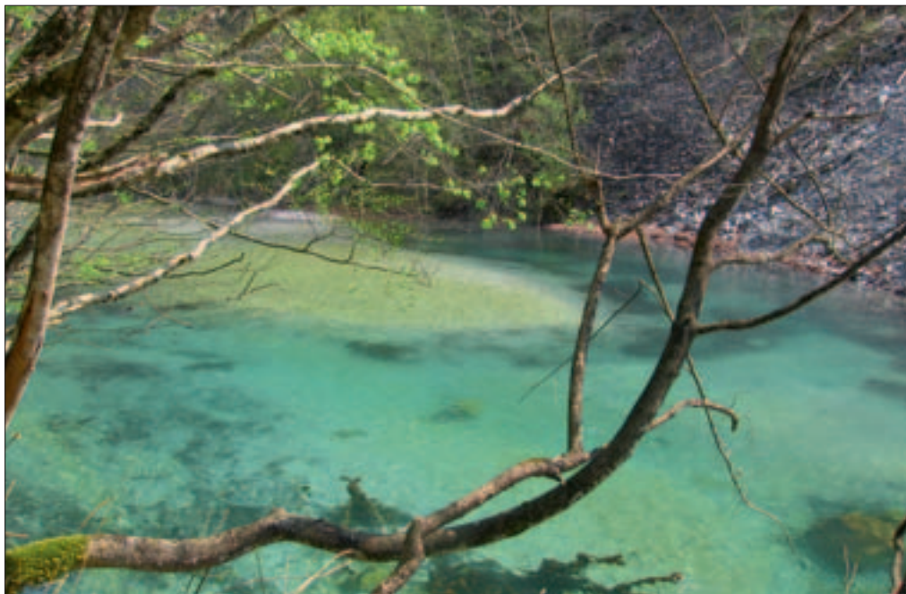
Slika 6: Na dnu jezera so se v obliki delte odlagali prod in drobnozrnati jezerski usedlinami (24. 4. 2006).