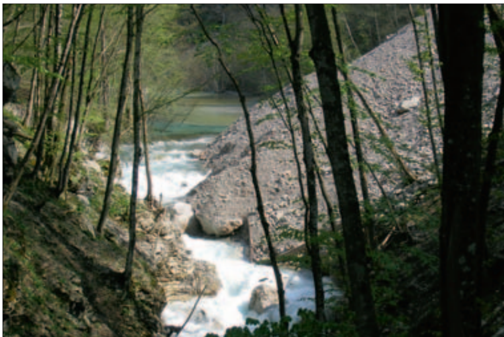
Slika 7: Nanos je zajezil Tolminke; spredaj: preboj Tolminke skozi podorno gradivo, zadaj: jezero (24. 4. 2006).