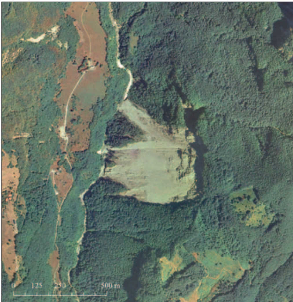
Slika 3: Barvni ortofotografski posnetek skalnega podora.

Kmalu po skalnem podoru so na strmem pobočju nastali globoki in široki erozijski jarki, po katerih je voda odnašala gradivo. Zaradi velikega naklona pobočja so se skale po njem valile le zaradi gravitacije.