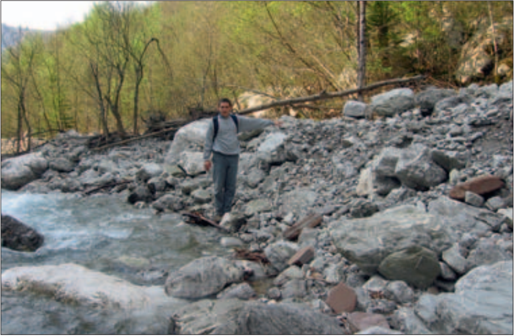
Slika 9: Tolminka je v dveh letih v odloženo gradivo pod skalni podorom vrezala okrog 1,5 m globoko strugo, od tega samo v desetih dneh po podoru za približno 1 m (24. 4. 2006).