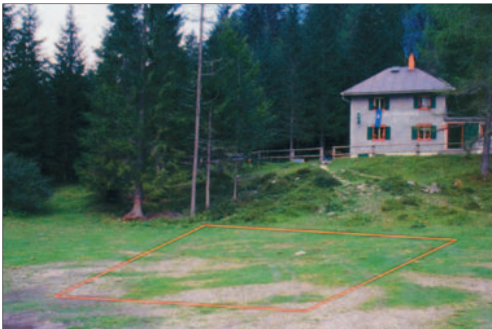
Slika 5: Kovinarska koč v Krmi. V ospredju je shematsko prikazano, kje bi lahko stale čistilne grede.