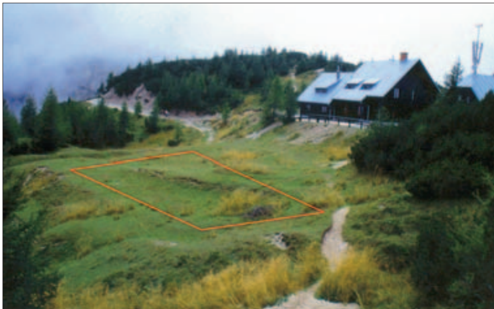
Slika 4: Poštarski dom na Vršiču (1688 m) bi lahko dobil najvišje ležečo rastlinsko čistilno napravo (za 80 PE, površina: 180 do 200 m 2 ). Romb prikazuje možno lego čistilnih gred.