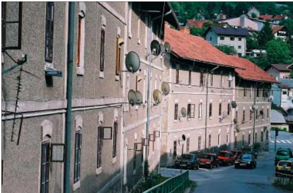
Slika 2: Podobe preteklosti – rudarske kolonije.

Ker je to generacija prehodnega obdobja, ne prevladuje enotna slika o pokrajini. Na eni strani se poslavlja od rudarstva, na drugi strani pa išče nove možnosti razvoja in redefiniranja prostora ter identitete. Ob vse večji globalizaciji in poenotenju se bo v prihodnosti prav gotovo pojavila potreba po večjem izpostavljanju lokalnih posebnosti. Za te sploh ni nujno, da so geografske ali zgodovinske danosti, ampak so lahko načrtno zgrajene, da bi pritegnile obiskovalce, kapital in zadržale domače prebivalce (Mlinar 1990, 1092).