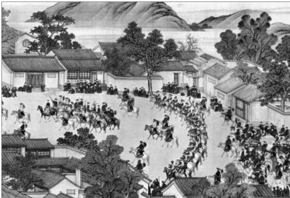
Slika 2: Medtem ko je Giuseppe Castiglione risal sloviti Lov v Mulanu, je Hallerstein kartiral deželo za zemljevide (Beurdeley in Beurdeley 1971).

opazil, kako se je postaral. Prepotoval je blizu 5000 km zračne razdalje v letu dni, dodatno pa so ga utrujali kitajski obredi s tisočletno tradicijo.