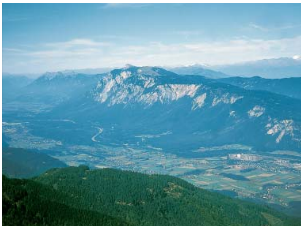
Slika 3: Območje Schütt je z gozdom porasla pokrajina pod južno steno Dobrača.