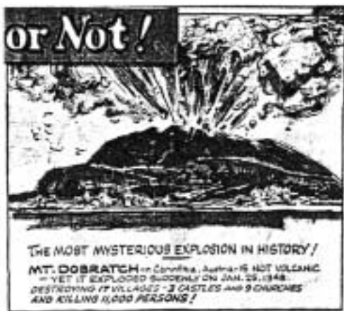
Slika 4: Poročanje ameriškega častnika Omaha World Herald o vulkanski eksploziji na Dobraču.

Najbolj očitne so razlike glede epicentra potresa. Starejši avtorji so navajali kot epicenter mesto Beljak oziroma njegovo okolico, novejši avtorji pa domnevajo, da je bil epicenter potresa v Furlaniji, kot na