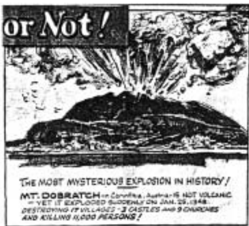
Slika 4: Poročanje ameriškega častnika Omaha World Herald o vulkanski eksploziji na Dobraču.

Najbolj očitne so razlike glede epicentra potresa. Starejši avtorji so navajali kot epicenter mesto Beljak oziroma njegovo okolico, novejši avtorji pa domnevajo, da je bil epicenter potresa v Furlaniji, kot na