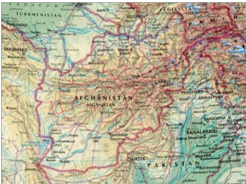
Slika 1: Lega Afganistana (Veliki atlas sveta, objavo zemljevida je dovolila založba DZS).