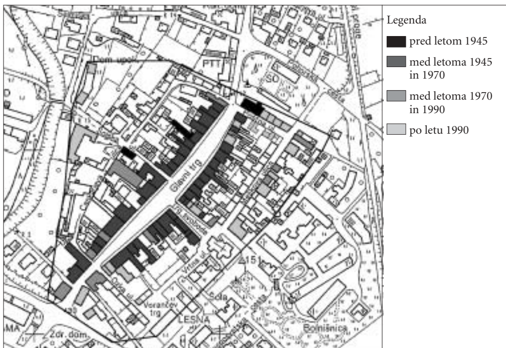
Slika 1: Obseg starega mestnega jedra in prostorsko širjenje lokalov med letoma 1945 in 2000.

njega Starega trga, potem skupno število prebivalcev komaj preseže 2000. Do leta 1948 se je število prebivalcev mestnega naselja (Slovenj Gradec in Stari trg skupaj) povečalo za tretjino, na 2695. Za preskrbo tako majhnega števila prebivalcev seveda ni bilo potrebnih veliko lokalov. Poleg tega pa v tistem času tako povpraševanje kot ponudba nista bili primerljivi z današnjima.